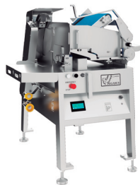
ミートスライサー GNS-350『ペガサス』