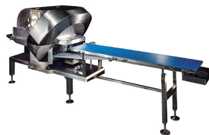
高速高性能スライサー NUS-340Ⅲ『ジュビターⅢ』