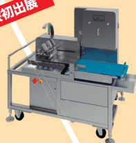
高速自動バンドソー NAB-250『ハーデス』