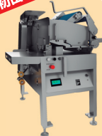
ミートスライサー GNS-350『ペガサス』