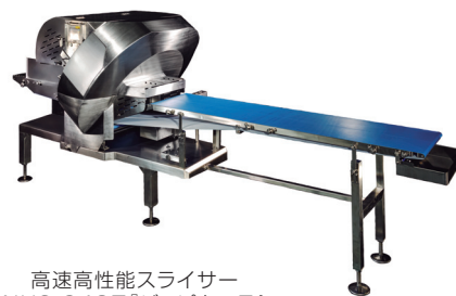
高速高性能スライサー NUS-340Ⅲ「ジュピターⅢ」