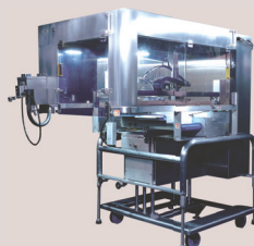
自動盛付ロボ CM-230「スコルピオン」