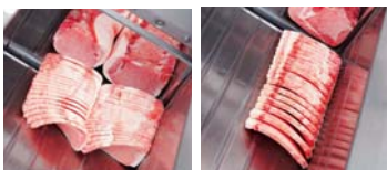
6.0mm厚・毎分250枚×2 10.0mm厚・毎分200枚