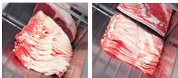
1.0mm厚・毎分380枚 2.0mm厚・毎分380枚×2

最大幅360mmまでの幅広い冷凍肉材（-5℃～-2℃）の薄切り、厚切りに対応。最速毎分380枚の高速スライスが行えます。