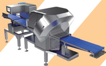
3D パック定量スライサー “ゼウス”

注目製品として、3月30日発売の最新型3Dパック定量スライサー『ゼウス』と自動盛付けロボ『スコーピオン』を組み合わせたスライス肉定量自動盛付ライン、段ボール自動開梱機『ABOT M1』にデパレタイザーとパラレルリンクロボットを連結した、全自動開梱ラインを出展するほか、専門スタッフ常駐による工場づくりのご相談の受付、ドイツ直輸入スパイスのご提案も行います。 (スライス肉定量自動盛付ラインは第1回FOOMAアワード2022優秀賞に選出されています。)