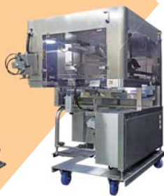
自動盛付けロボ “スコーピオン”