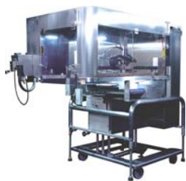
自動盛付ロボ CM-230『スコーピオン』