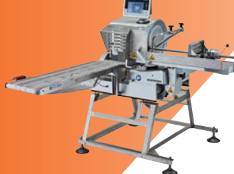
オートマチックスライサー BIZERBA VSI-F TW