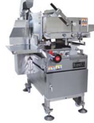
ハイクリーンミートスライサー NAS-330S『ヘルメス』