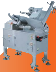
冷凍スライサー NF-410『レアAD』