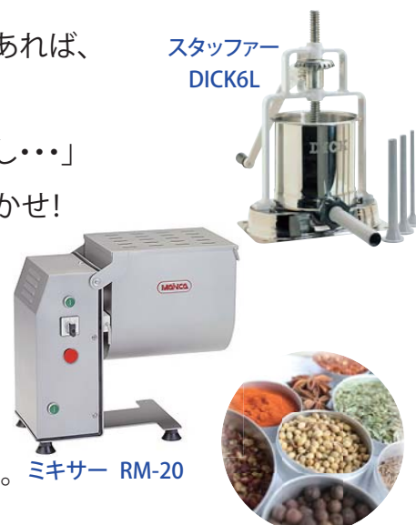
メツゲライマーティン 各種スパイス